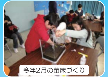
今年2月の苗床づくり