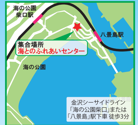
金沢シーサイドライン 「海の公園柴口」または 「八景島」駅下車徒歩3分