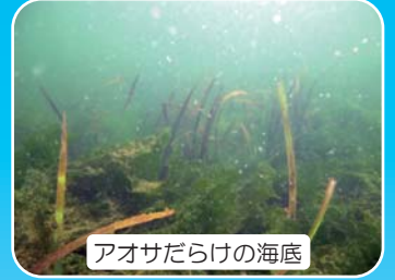
アオサだらけの海底

今回の学習会は、大ピンチのアマモ場が元気に 復活するのをお手伝いするために、みんな 苗床 づくり をします。ぜひ参加してくださいね^^